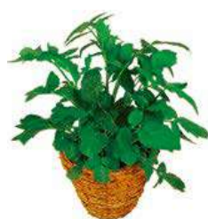
■ Valeriana officinalis