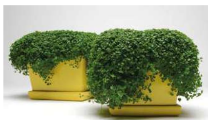
■ Mentha Mini Mint